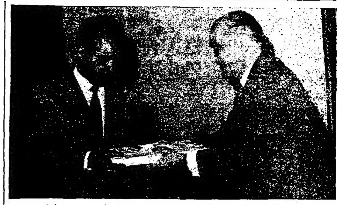
السيد بهجت القزويني رئيس الوزراء يقيم حية الى السيد عبد الحميد الكوش رئيس وزراء ليبيا